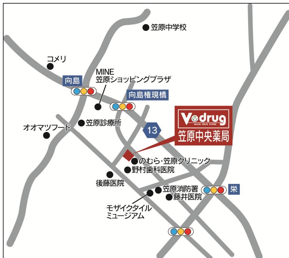
笠原中央薬局 地図