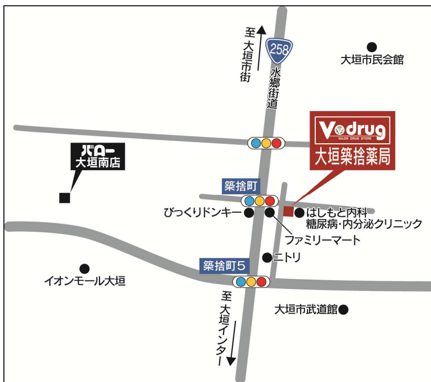
大垣築捨薬局 地図