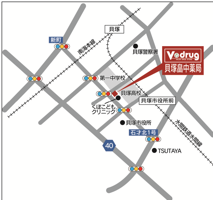
貝塚畠中薬局 地図