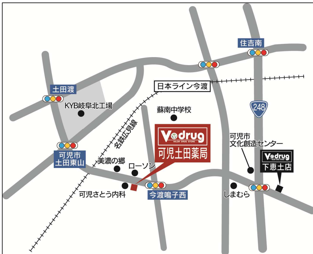
可児土田薬局 地図