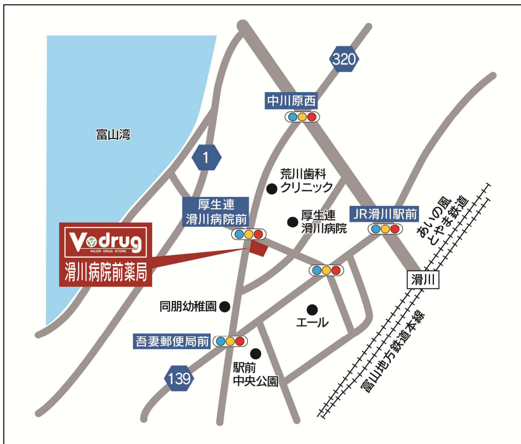
滑川病院前薬局 地図