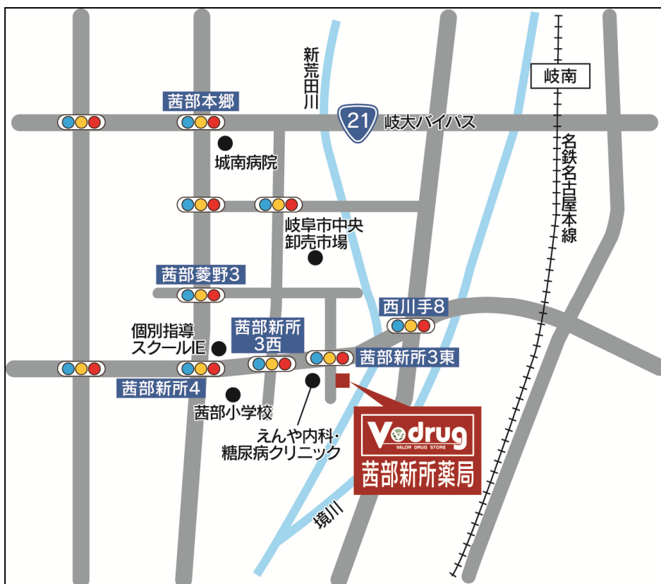
茜部新所薬局 地図

*岐阜県の店舗数には、有限会社ひだ薬局、有限会社サンファーマシー、有限会社アオイ薬局の店舗を含む