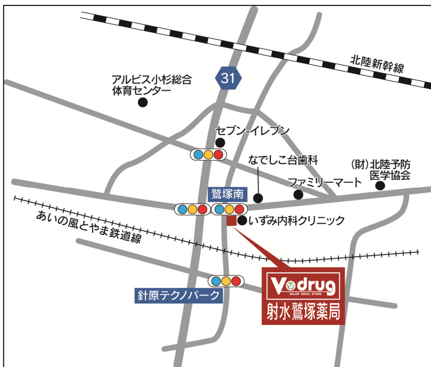
射水鷺塚薬局 地図

*岐阜県の店舗数には、有限会社ひだ薬局、有限会社サンファーマシー、有限会社アオイ薬局の店舗を含む