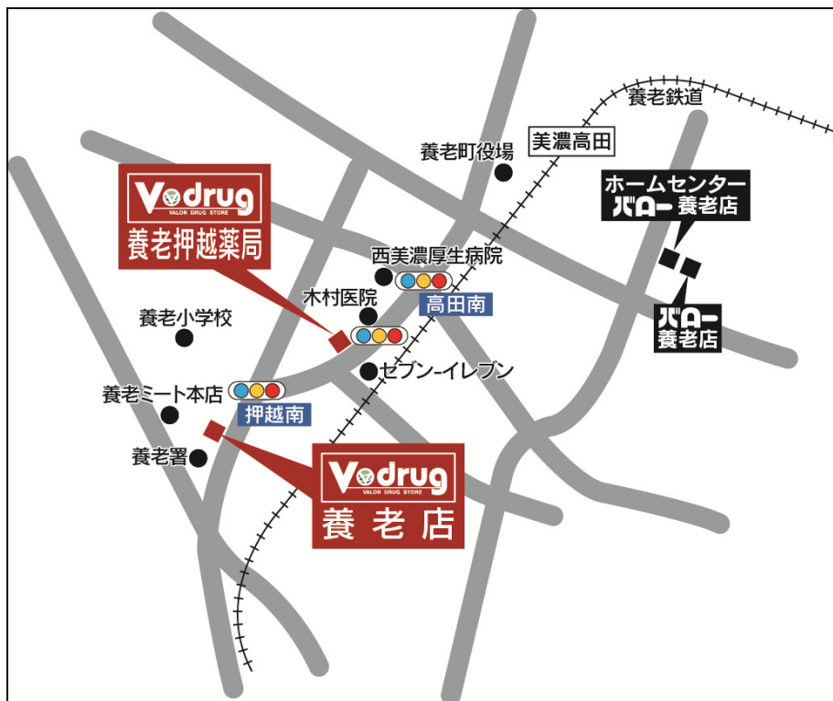
養老押越薬局 地図

*岐阜県の店舗数には、有限会社ひだ薬局、有限会社サンファーマシー、有限会社アオイ薬局の店舗を含む