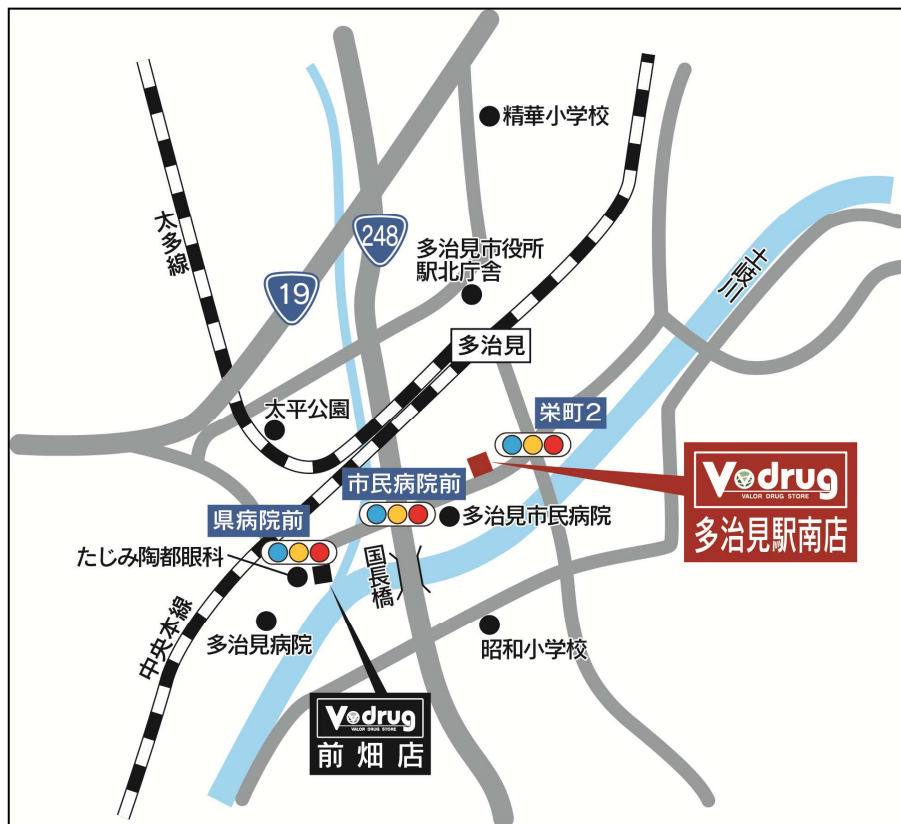
多治見駅南店 地図