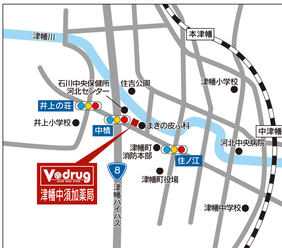
津幡中須加薬局 地図