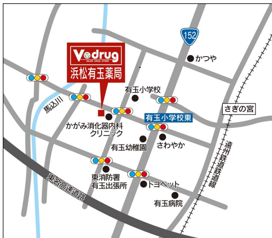
浜松有玉薬局 地図