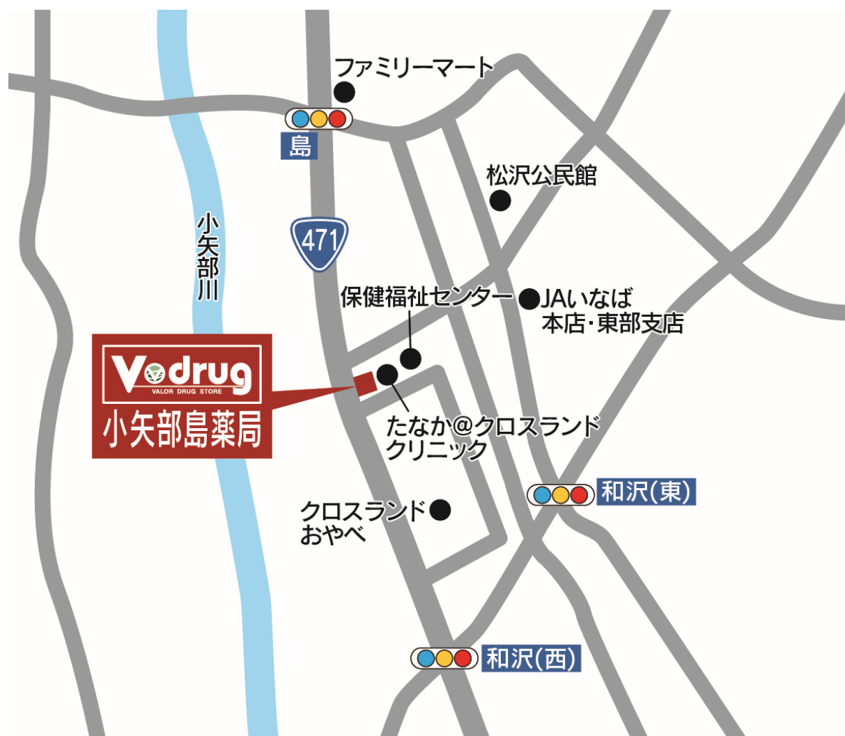
小矢部島薬局 地図