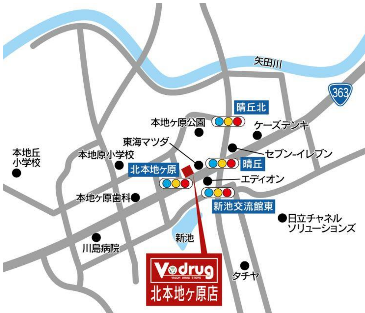
北本地ヶ原店 地図