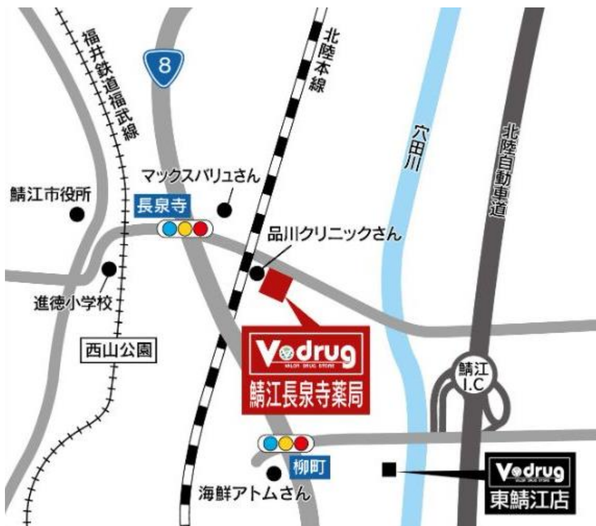
鯖江長泉寺薬局 地図