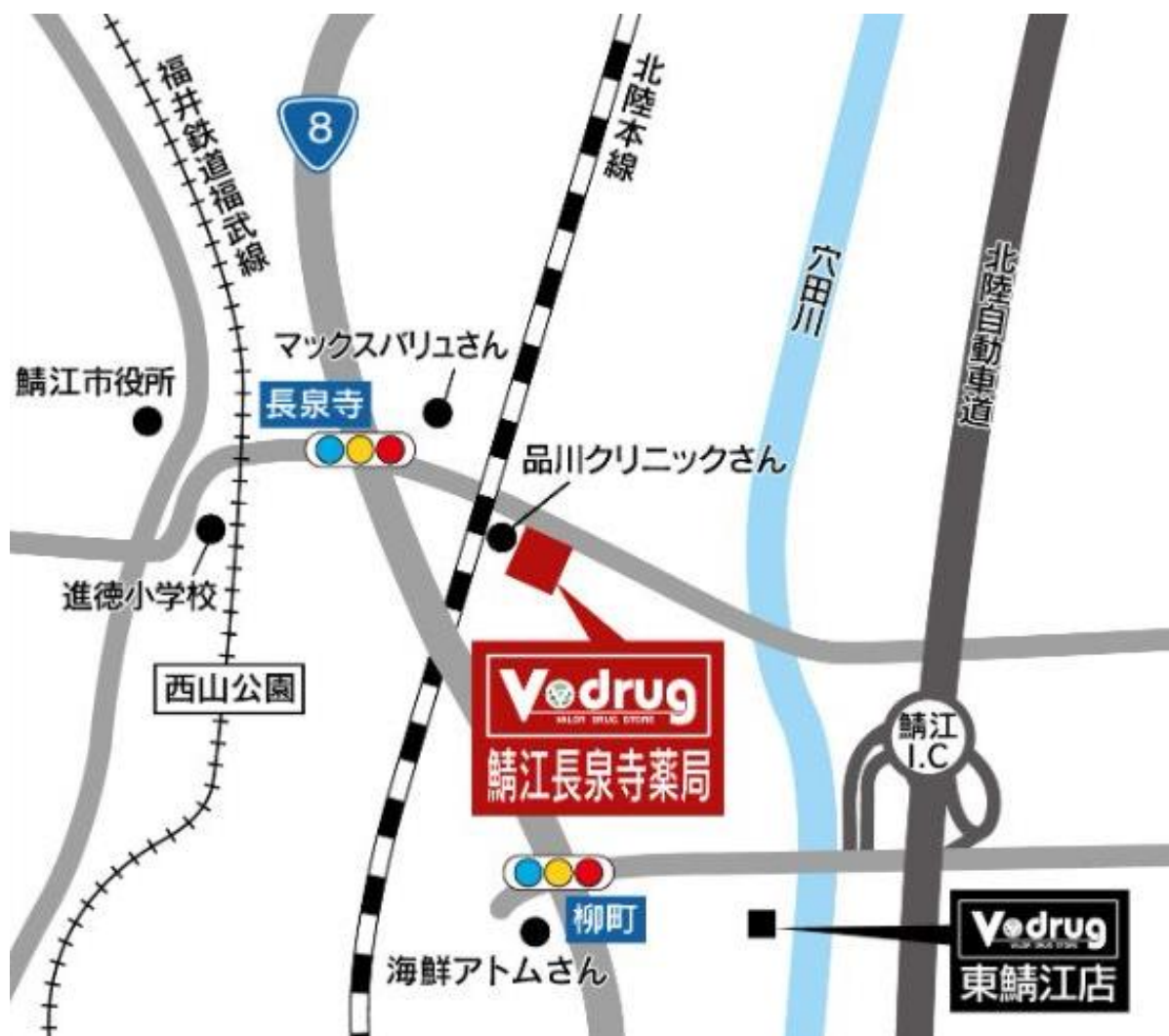
鯖江長泉寺薬局 地図