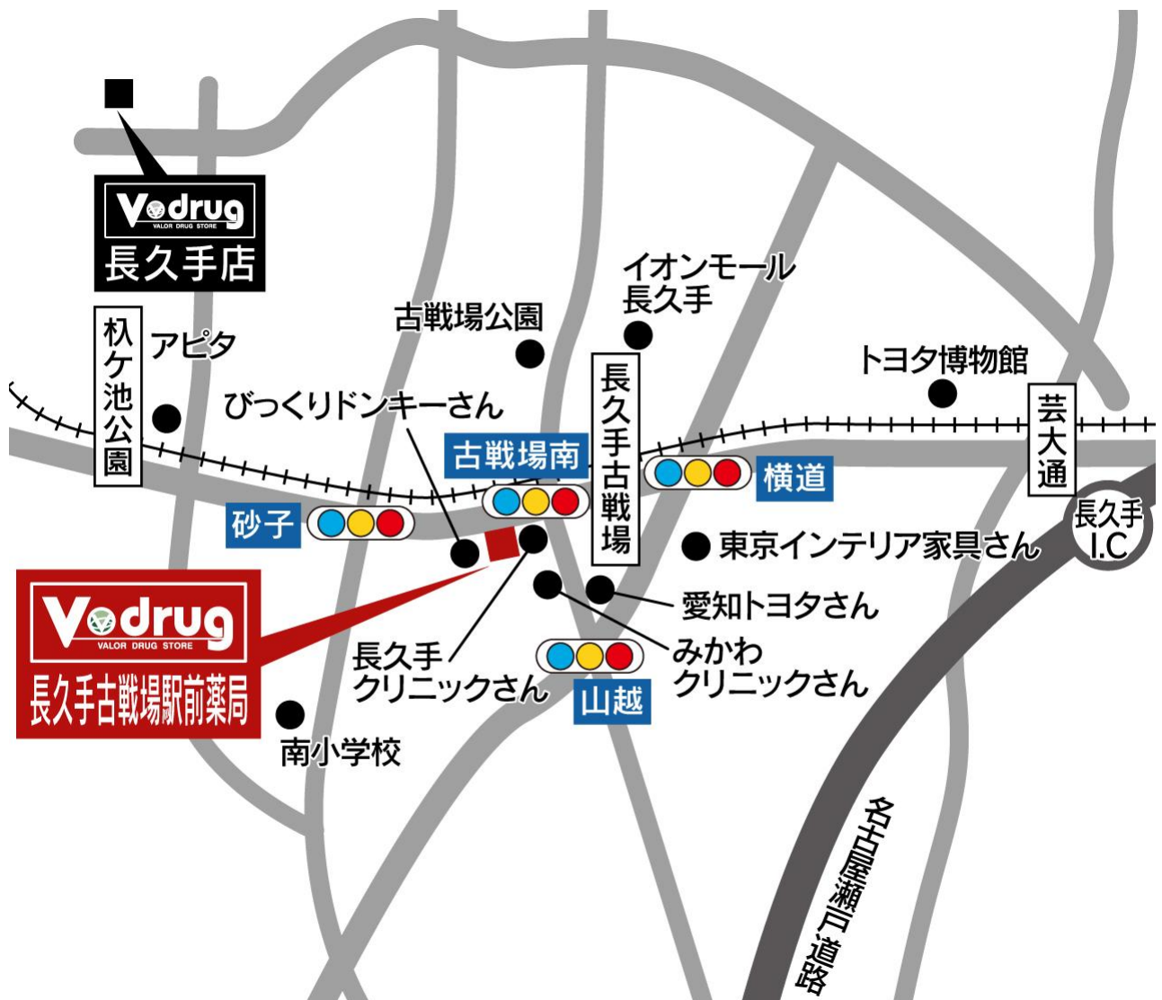
長久手古戦場駅前薬局 地図