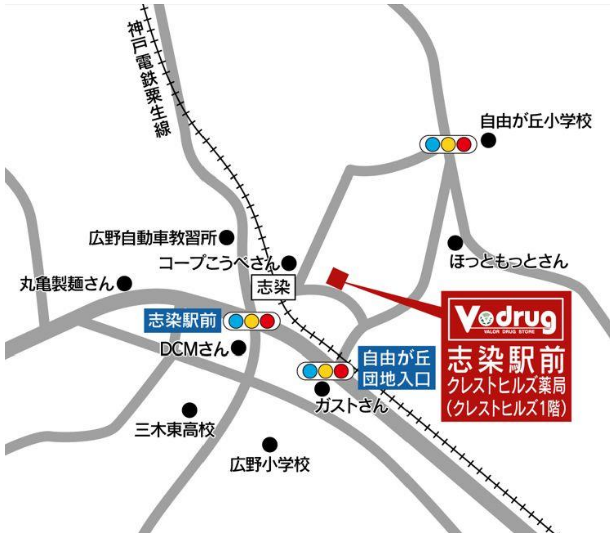
志染駅前クレストヒルズ薬局 地図