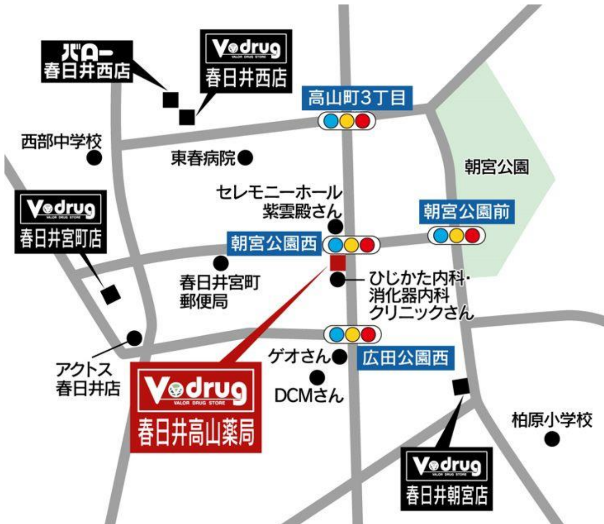
春日井高山薬局 地図