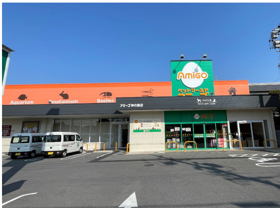
【ペットワールドアミーゴ神の倉店外観】