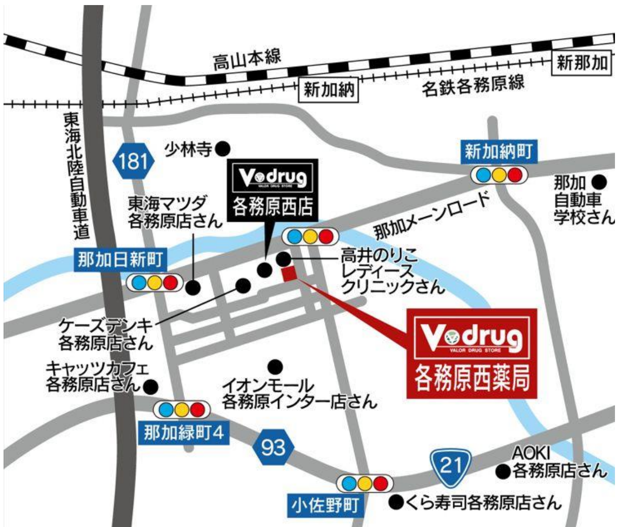
各務原西薬局 地図