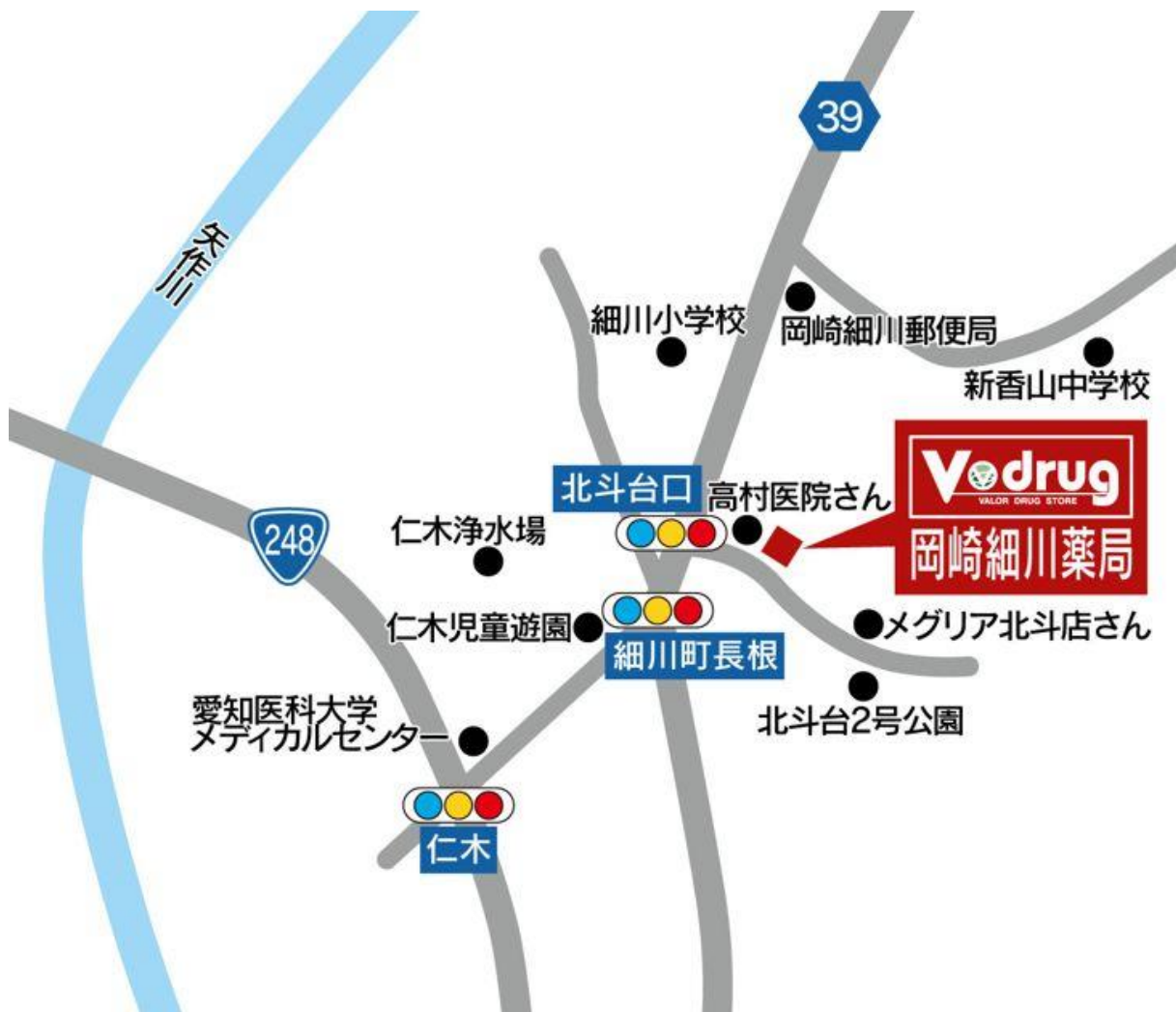
岡崎細川薬局 地図