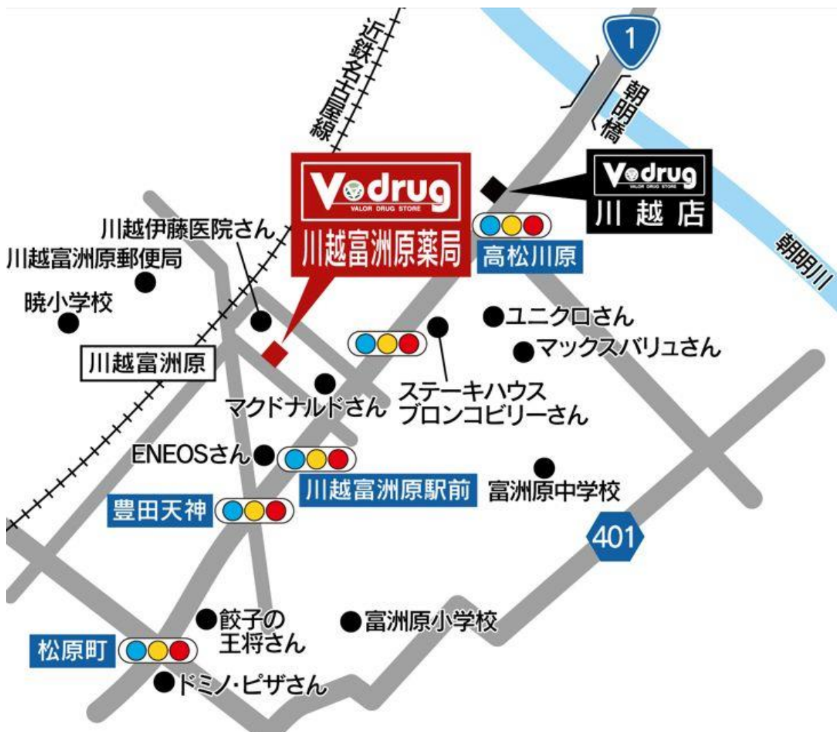
川越富洲原薬局 地図