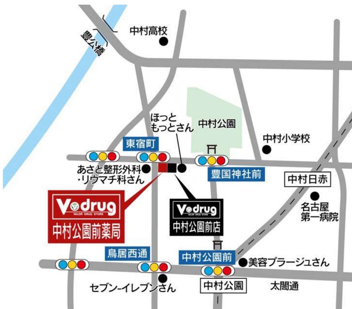
中村公園前薬局 地図