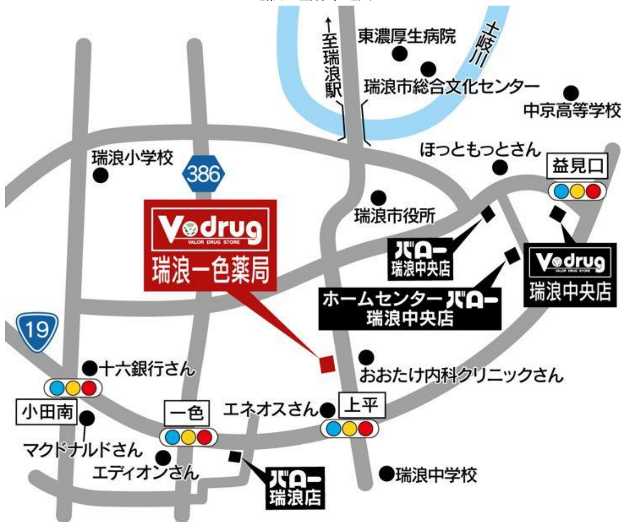
瑞浪一色薬局 地図