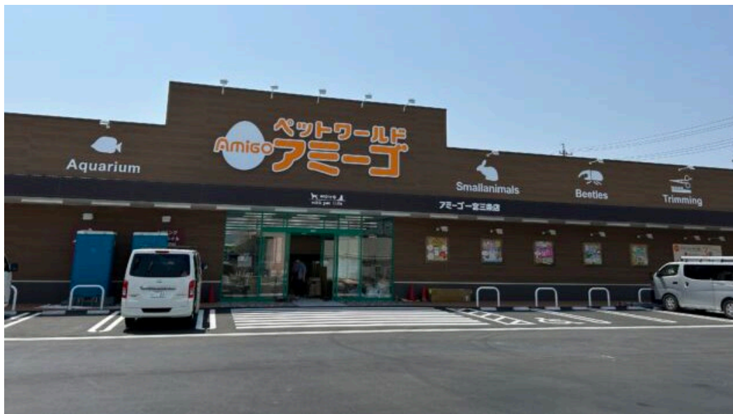
【ペットワールドアミーゴ宮三条店外観】