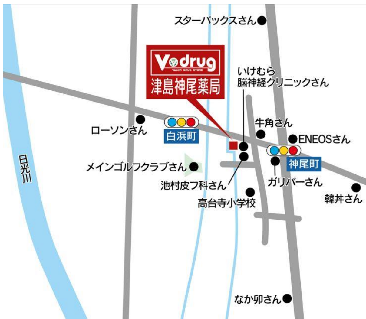
津島神尾薬局 地図