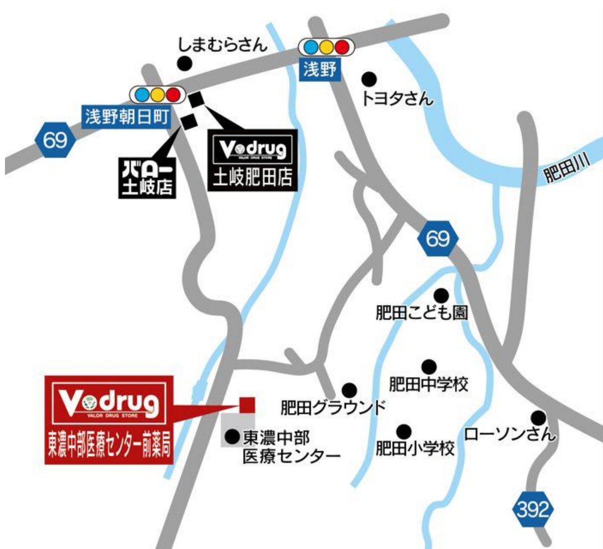
東濃中部医療センター前薬局 地図