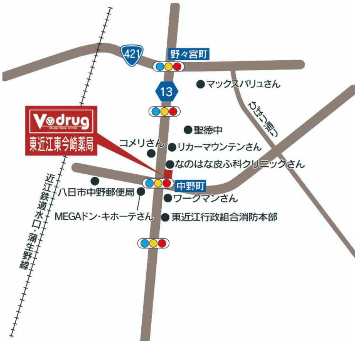
東近江東今崎薬局 地図

*岐阜県の調剤専門薬局には、株式会社みお薬局、有限会社愛進堂薬局、株式会社 COZY の店舗を含む