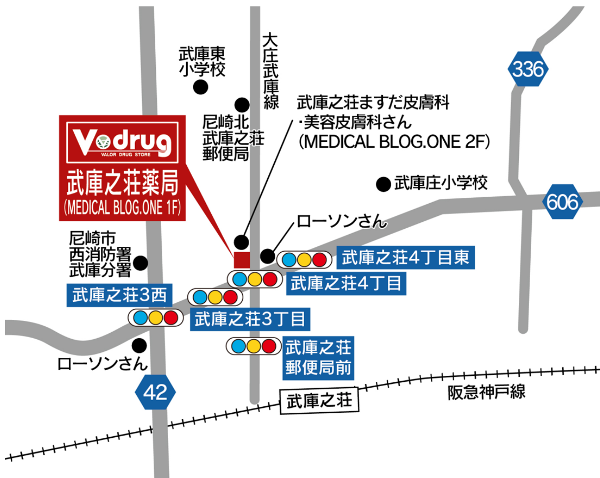
武庫之荘薬局 地図

*岐阜県の調剤専門薬局には、株式会社みお薬局、有限会社愛進堂薬局、株式会社 COZY の店舗を含む