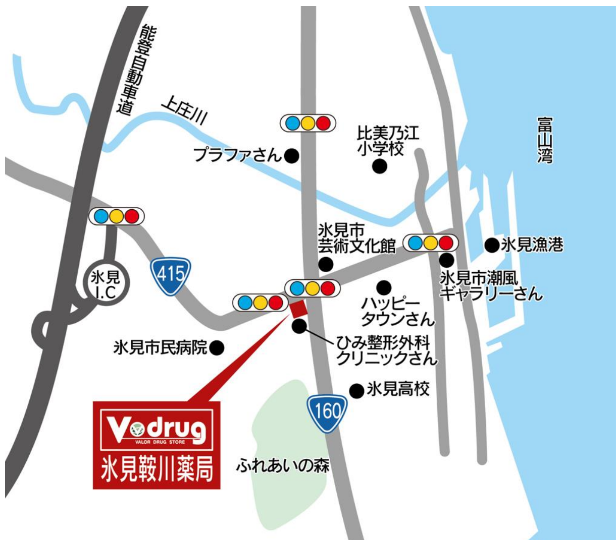
氷見鞍川薬局 地図

*岐阜県の調剤専門薬局には、株式会社みお薬局、有限会社愛進堂薬局、株式会社 COZY の店舗を含む