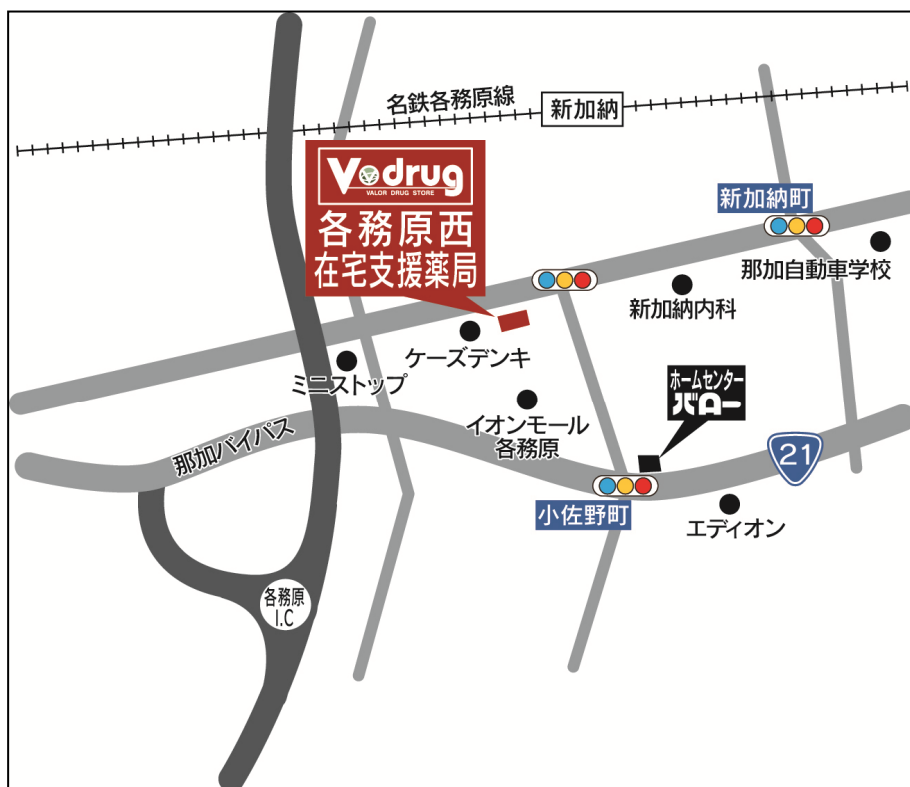
各務原西 在宅支援薬局地図