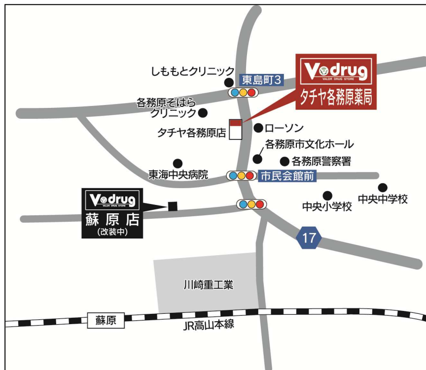
タチヤ各務原薬局 地図