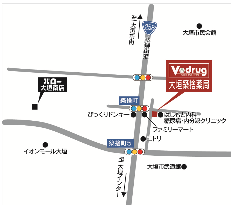
大垣築捨薬局 地図