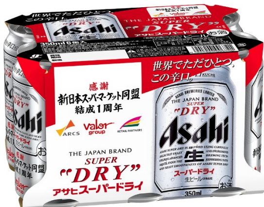
< 6缶パック >