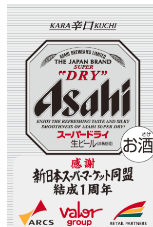
< 商品ラベル >