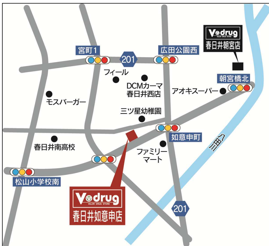
春日井如意申店地図

*岐阜県の調剤専門薬局には、有限会社ひだ薬局、有限会社サンファーマシーの店舗を含む