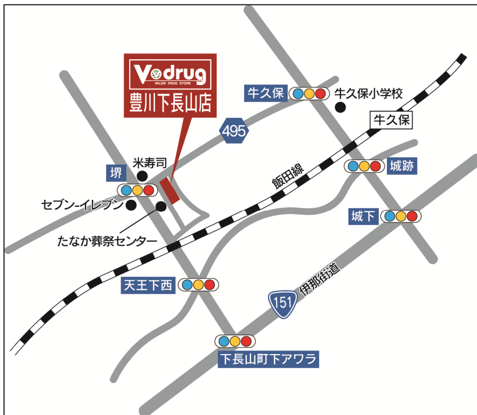
豊川下長山店地図

*岐阜県の店舗数には、有限会社ひだ薬局、有限会社サンファーマシー、有限会社アオイ薬局の店舗を含む