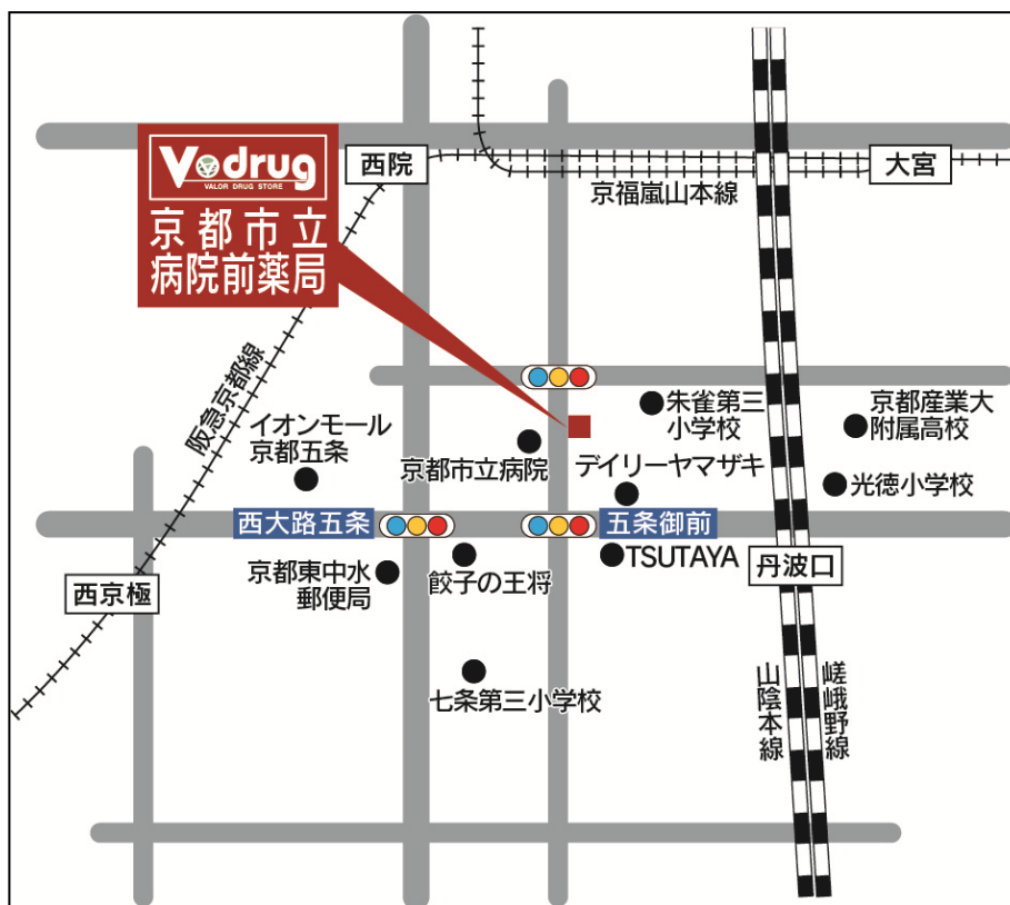
京都市立病院前薬局 地図

*岐阜県の店舗数には、有限会社ひだ薬局、有限会社サンファーマシー、有限会社アオイ薬局の店舗を含む