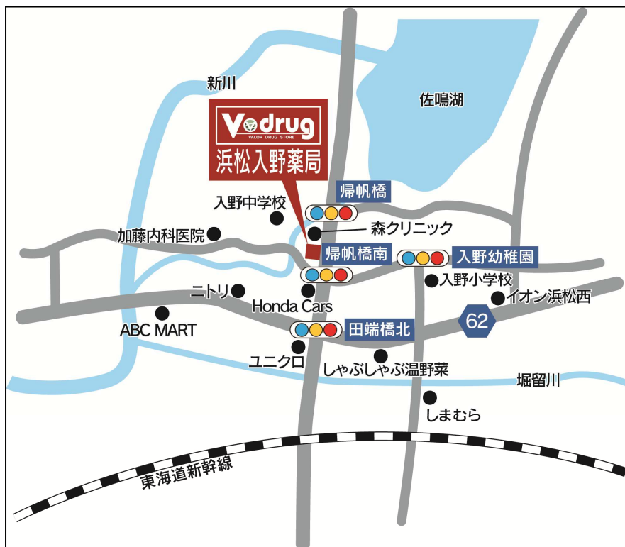
浜松入野薬局 地図